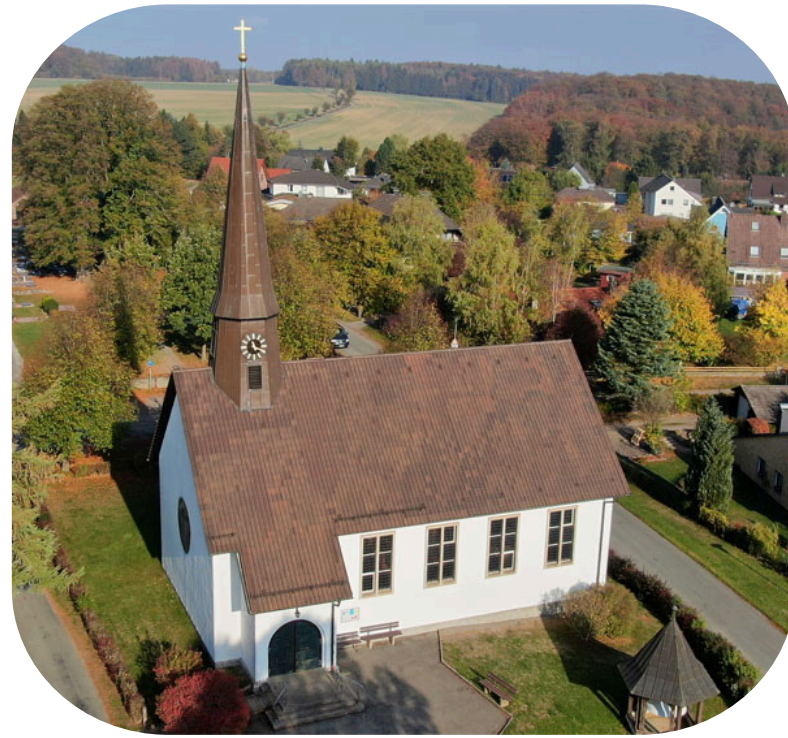
Kapelle zum guten Hirten