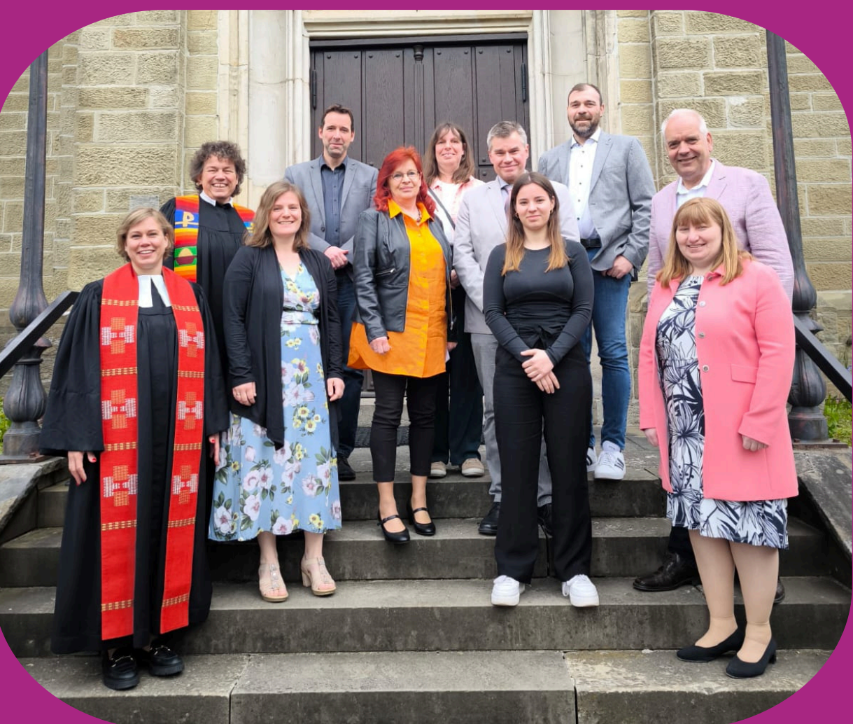
Unser neuer Kirchenvorstand