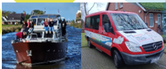
Bootsfreizeit 2019 und Mercedes Sprinter

Gestaltungsraum für eigene Ideen und Schwerpunkte